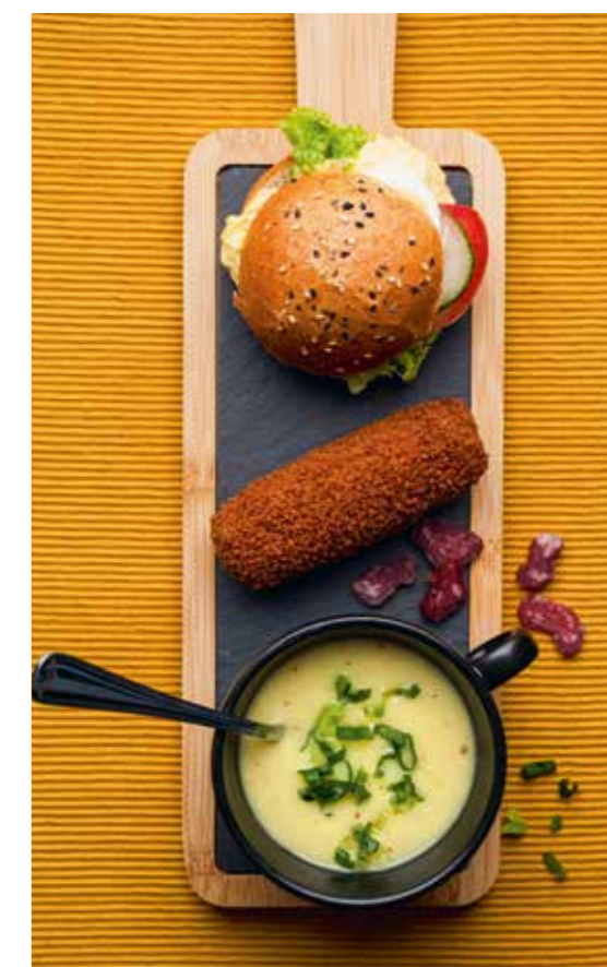
▲ Een twaalf-uurtje biedt alles in één.

De specifieke mogelijkheden en arrangementen zijn te vinden op onze website.